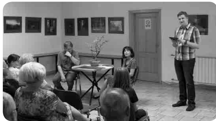
Razstava Stanka Urnauta

Kot voditeljica fotosekcije in razstav se zavedam, da v programu ni mogoče naštetih vseh podrobnosti. Za določeno razstavo z ustvarjalcem po tehtnem premisleku izbereva likovna dela vedno na osnovi estetskega vrednotenja. Pri tem je potrebno upoštevati temo, likovno strukturo in stil. Tukaj se pojavi zanimivo vprašanje – kako se na splošno občuti umetnost v današnjem času? »Umetniškega« ustvarjanja je danes na pretek in vsak ustvarjalec si lahko »svobodno« izoblikuje svoj stil na podlagi poznavanja likovnih tehnik in detajlov na eni ter novih trendov, ki pa se zelo hitro spreminjajo, na drugi strani. Znanja na področju likovnih tehnik so vsekakor sprejemljiva, privlačna in dobrodošla, še posebej, če so statusno obarvana ter hkrati vodijo v novi, a pravi kult lepote. Zaželeno pa je, da bi bila ta vsakokratna lepota definirana v pravem tonusu. S tem pa se jedro lepega spreminja in kult estetike začenja odražati na novih ravneh. Vsi, ki se tako ali drugače ukvarjamo z umetnostjo, vemo, da lepota umetnin brez estetike lahko postane prazna, kult lepote brez okusa pa kičast. Mnoge umetnine velikokrat žal postanejo zelo dolgočasne, prostor se zapolni,