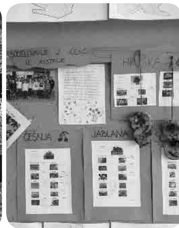
Izdelali smo koledarčke