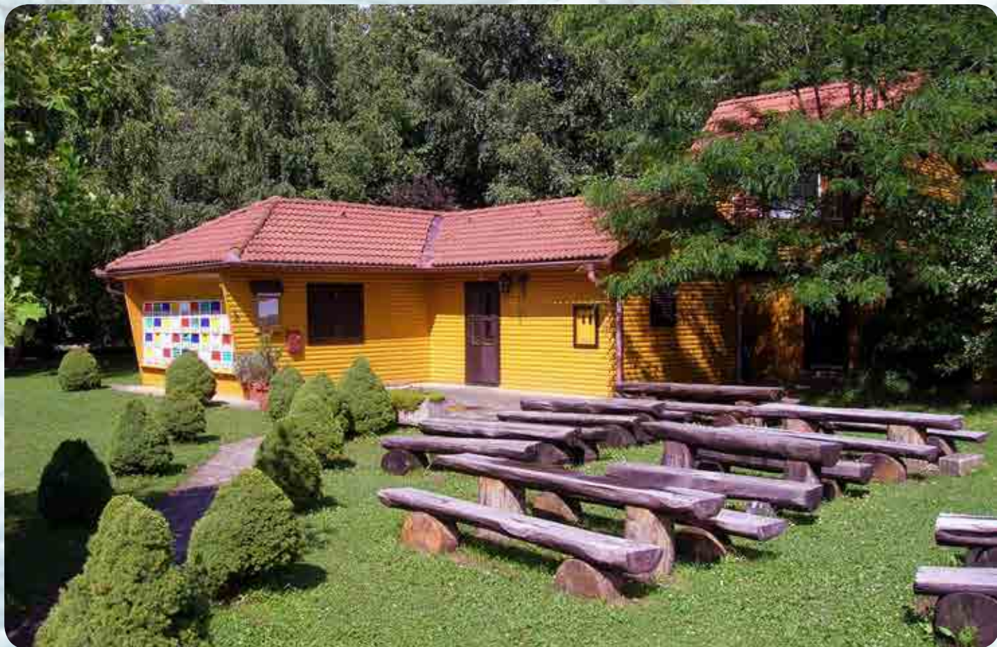
Čebelarski dom, zgrajen leta 1996