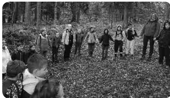
Obiskali smo gozd