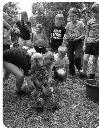
Posadili smo bor

našo šolo in tudi sama sem jih obiskala konec maja letos. Podarili smo si drevesa, kot simbol sodelovanja in povezovanja. Mi smo njim podarili hruško, ki sicer ni ravno domorodno drevo za tisto območje, oni pa so nam podarili višinski bor. Posadili smo ga v šolskem parku.