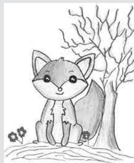
Dolores Bokan, 7. razred

O, naše Zvite novice! Omamijo te s pogledom, okužijo te z vsevedom. Beli listi vabijo te, da z njimi pozabavaš se.